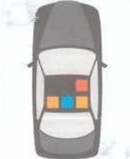
СХЕМА МЕСТ УСТАНОВКИ ДЕТСКИХ КРЕСЕЛ В АВТОМОБИЛЕ

Устанавливайте детские автокресла на переднем сиденье автомобиля, только если это будет специальное сиденье безопасности переднего пассажира. Если такое сиденье в автомобиле не предусмотрено — детям можно и нужно находиться только на заднем сиденье!